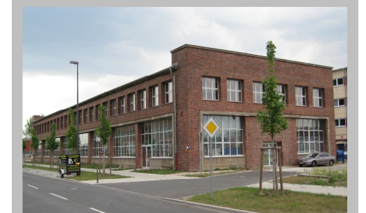
Gebäudeansicht Haus 10