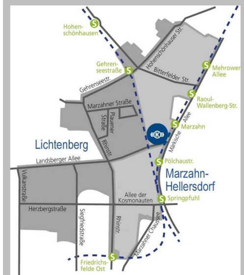
Lage des Gewerbeparks im Gewerbeareal Berlin-eastside