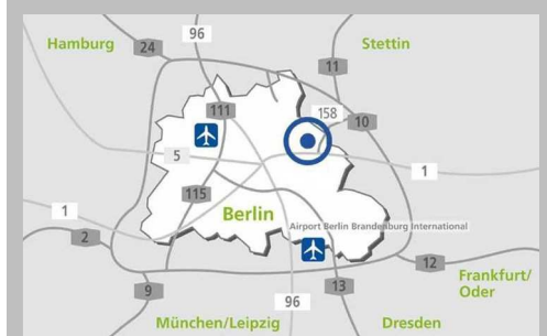
Makrolage Gewerbepark und Gewerbeareal Berlin-eastside